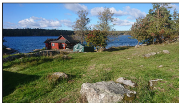
Vy över ängen ned mot vattnet.