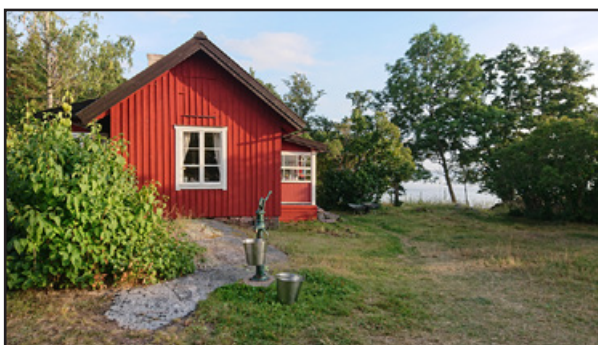
Claras stuga (här bor man).

Med bil från Stockholm via väg 73 mot Handen och därifrån väg 227 mot Dalarö (restid Handen–Dalarö cirka 30 min). Från Hotellbryggan i Dalarö går bilfärja till Hässelmara på Ornö (tar cirka 25 min). Bilar ska alltid bokas i båda riktningarna på www.ornosjotrafik.se . Färjan är privat, biljetterna betalas på nätet i samband med bokningen eller